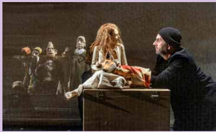
Koproduktion Theater Waidspeicher (D) und Ulrike Quade Company (NL)

Repertoire: Die Liebe der kleinen Mouche • Rumpelstilzchen • Amadeus Drei dicke Freunde • Leon Pirat • Das Märchen von Trollkind und Königskind • Mein ziemlich seltsamer Freund Walter • Als mein Vater ein Busch wurde und ich meinen Namen verlor • Ritter Tristan und Prinzessin Isolde • Das kalte Herz • Club Orange • Die Vielfalt der Puppenwelt